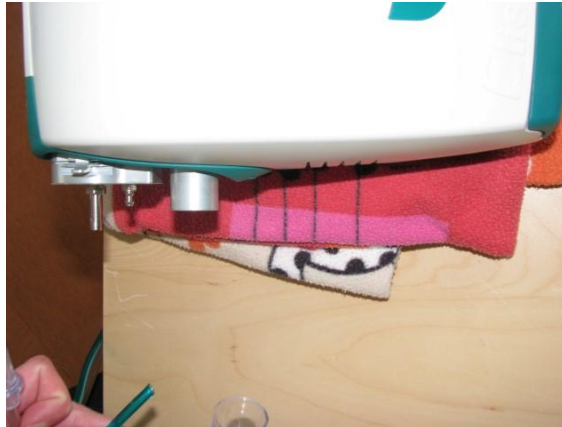
5) dann auf „weiter“ drücken, Gerät arbeitet, kurz warten