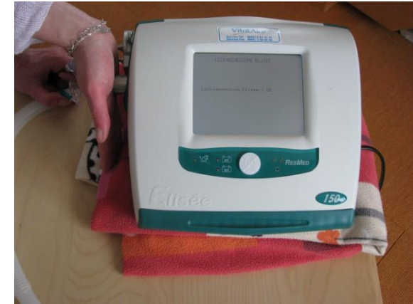
6) Inspiration mit flacher Hand verschliessen, mit der anderen auf „weiter“ drücken