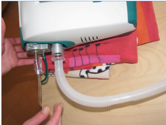
7) Schläuche (ohne Gänsegurgel, ohne Bakterienfilter!) anstecken, „weiter“ drücken, abwarten