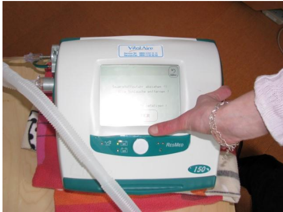
4) Anweisung befolgen: alle Schläuche abziehen, Sauerstoffzufuhr hinten entfernen